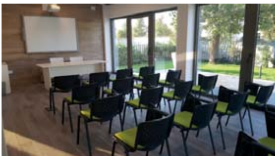
La nuova struttura ospita due sale dedicate appositamente alla formazione.

scil è presente su tutto il territorio nazionale con una grande forza vendita selezionata per la professionalità, serietà e lunga esperienza nel mondo veterinario. Nel nostro team ci sono medici veterinari specializzati per linea di prodotto, che affiancano i venditori e i clienti nel processo decisionale e per ogni successiva consulenza tecnico-scientifica. Il nostro obiettivo è da sempre quello di costruire insieme ai nostri clienti una lunga e soddisfacente collaborazione, che vada ben oltre la singola vendita del momento. ▲