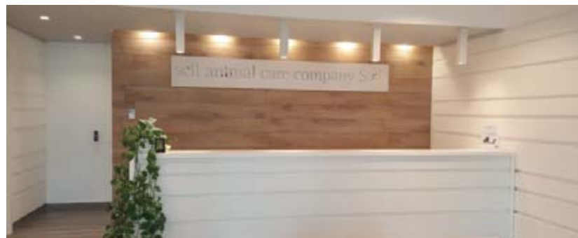
Tutte le nuove sedi, come quella di Treviglio, sono costruite con l'obiettivo "emissioni zero".

Con un'ampia gamma di contaglobuli automatici, analizzatori di chimica clinica ed elettroliti, analizzatori per la coagulazione, per la tipizzazio-