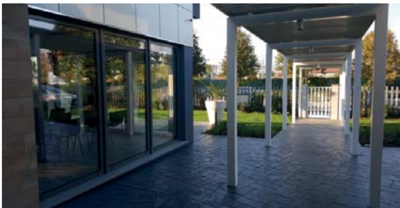
La nuova sede di scil Italia che si trova a Treviglio.

A poco più di un mese dall'inaugurazione della nuova sede di scil Italia, che si è tenuta lo scorso 28 agosto alla presenza di tutti i collaboratori scil che hanno contribuito al raggiungimento di tale traguardo e al team commerciale di scil Francia e Germania, vi raccontiamo un po' di noi, da dove siamo partiti e quali sono i nostri progetti futuri.